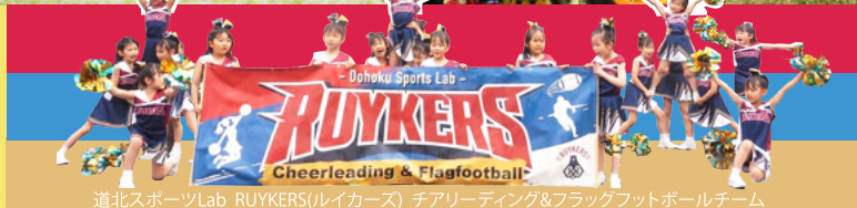
道北スポーツLab RUYKERS(レイカース) チアリーディング&フラッグフットボールチーム

※マイバイクでご参加ください ※キッズバイク、ヘルメット、 プロテクターは無料で貸出します